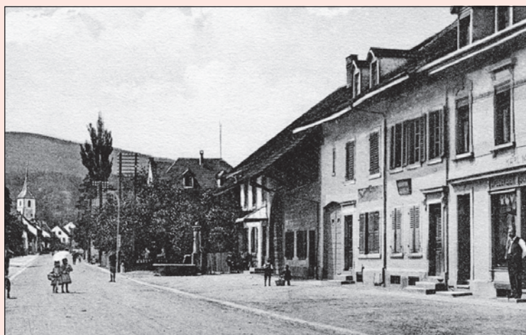
Um 1910 (Poststempel 1919) mit den Häuser Nr. 87–91.