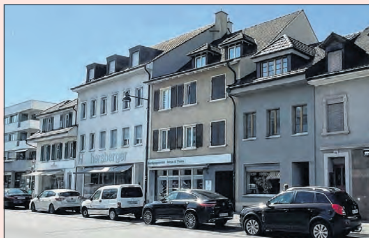
Gleicher Standort 2021.