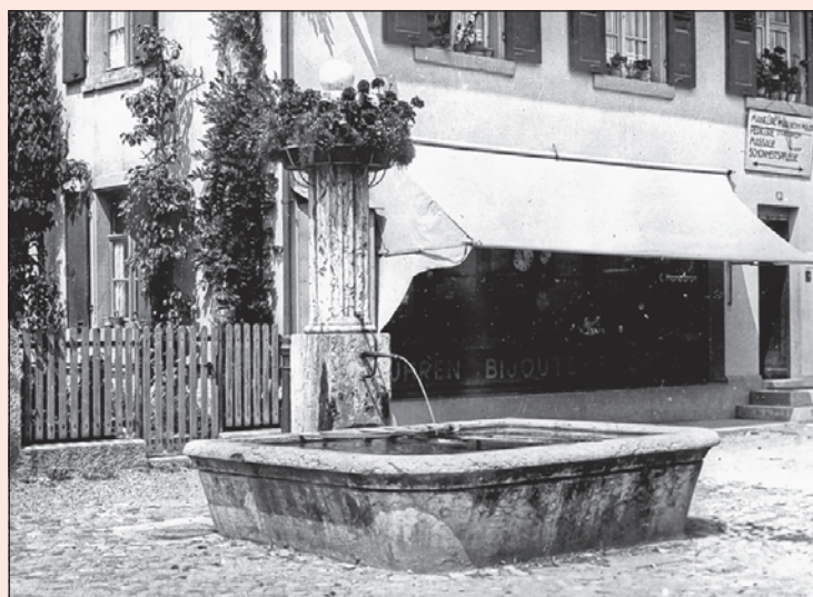
Blick auf das Wohn- und Geschäftshaus Nr. 87 an der Ecke Brühlweg/ Hauptstrasse. Der Brunnen wurde unterdessen vor das Postgebäude gegenüber versetzt.