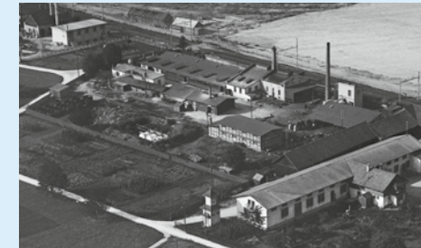
Flugbild 1924 mit ehem. Dachpappi /CTW sowie Fass- und Sauerkrautfabrik Haass.

Der Rundgang gibt Einblick in die Zeit der Industrialisierung vom Ende des 19. bis Mitte des 20. Jahrhunderts, von der Dalang-Teigwarenfabrik zum Beton-Christen, weiter zum Pantheon und zur Florin AG bis zur Fass- und Sauerkrautfabrik Haass.