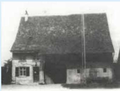
Ehemals Hauptstrasse 15.

In Muttenz sind in Laufe der Zeit einige alte Bauernhäuser abgerissen worden und somit verschwunden. Der Walk besucht die ehemaligen Standorte dieser Bauernhäuser. Wir zeigen dort Bilder dieser Bauernhöfe und geben Infos dazu.