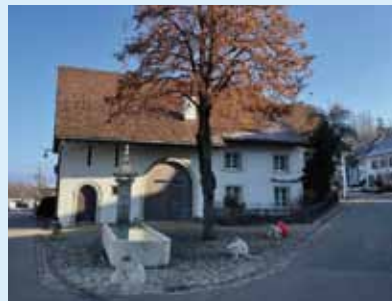
Burggasse Nr. 9.

Der Rundgang zeigt die wichtigsten Häuser im Bereich Oberdorf, Gempengasse, Burggasse, Geispelgasse und Baselstrasse.