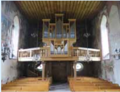
Blick auf Westwand mit Orgel und Jüngstem Gericht.

Die Wehrkirche St. Arbogast ist das einzige Gotteshaus in der Schweiz, welches von einer fast kreisförmigen Ringmauer ganz umschlossen ist. Sehenswert sind auch die Fresken aus dem 15. und 16. Jahrhundert im Inneren der Kirche und im Beinhaus, sowie die Grenzsteinsammlung im ehemaligen Friedhof.