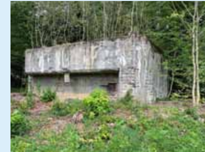
Bunker auf der Rütihard.

Der Rundgang entlang der Befestigungslinie des 2. Weltkriegs zeigt die Vorbereitungen und Überlegungen zur Verteidigung in jenen bedrohlichen Jahren. Mit Zitaten aus der Zeit.