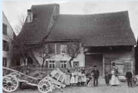
Das älteste Bauernhaus, Hauptstrasse 23/25.

Der Rundgang zeigt die wichtigsten Häuser in der Hauptstrasse und am Kirchplatz.