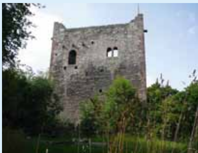
Mittlere Ruine Wartenberg.

Der gesamte Rundgang ist knapp 9 km lang, kann aber auch aufgeteilt werden.